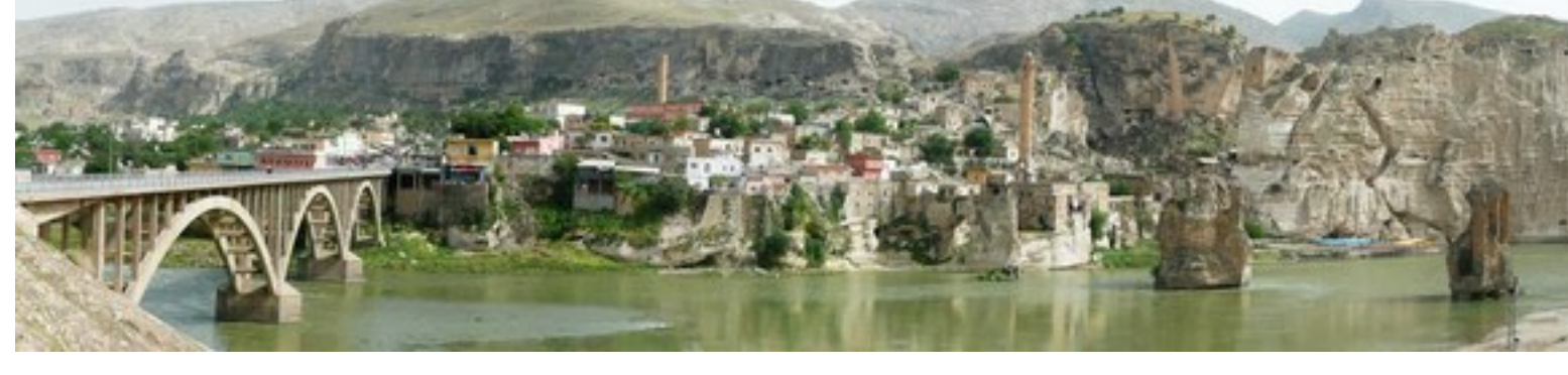
Hasankeyf (ook: Heskif, Aramees/Syrisch: Hesno d-kifo, "Vesting van steen", Grieks: Κίφας/Kíphas) is een antieke stadvesting met een grote geschiedenis gelegen aan de Tigris in de Turkse provincie Batman. (wikipedia)